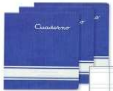
Pauta 3'5 (dos líneas)

Seguir la pauta propuesta de renglón y cuadrícula (generalmente viene en la parte posterior del cuaderno)